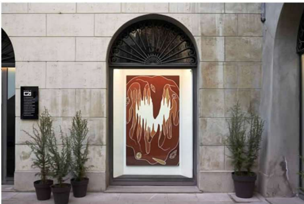
Andreco – Ground Water, installation view, Reggio Emilia, Italy