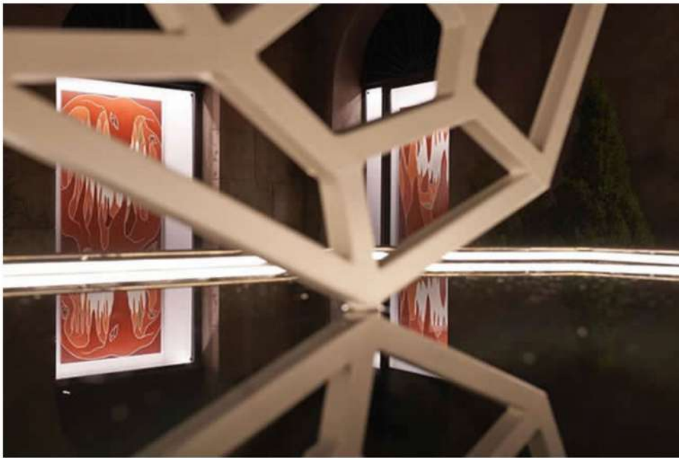
Andreco – Ground Water, installation view, Reggio Emilia, Italy