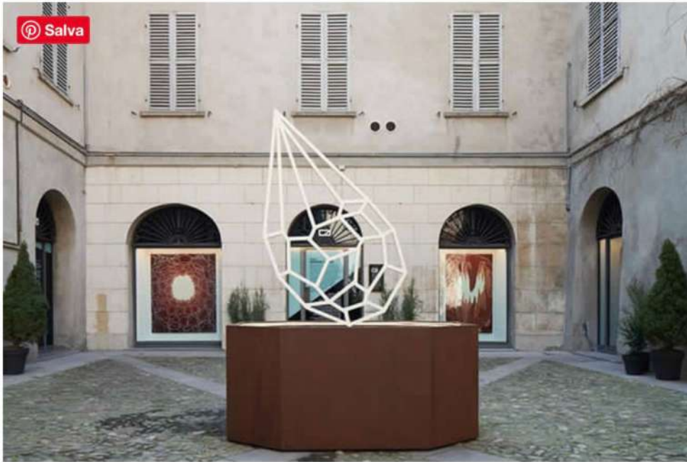
Andreco – Ground Water, installation view, Reggio Emilia, Italy