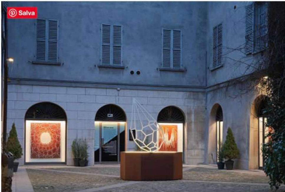
Andreco – Ground Water, installation view, Reggio Emilia, Italy

“Il protagonista dei dipinti è il vuoto – dice Andreco – lo spazio conquistato dalla risorsa idrica grazie a fenomeni fisico-chimici di trasformazione della materia . Le tele svelano l'invisibile, mostrano il bagliore che illumina le cavità sotterranee, osservato dalla prospettiva oscura del loro interno. L'operazione intende costruire un terreno di rispetto e di cura nei confronti delle geologie profonde e delle risorse naturali, un'azione indispensabile per istituire un equilibrio simbiotico tra gli esseri viventi e l'ecosistema planetario di cui fanno parte.”